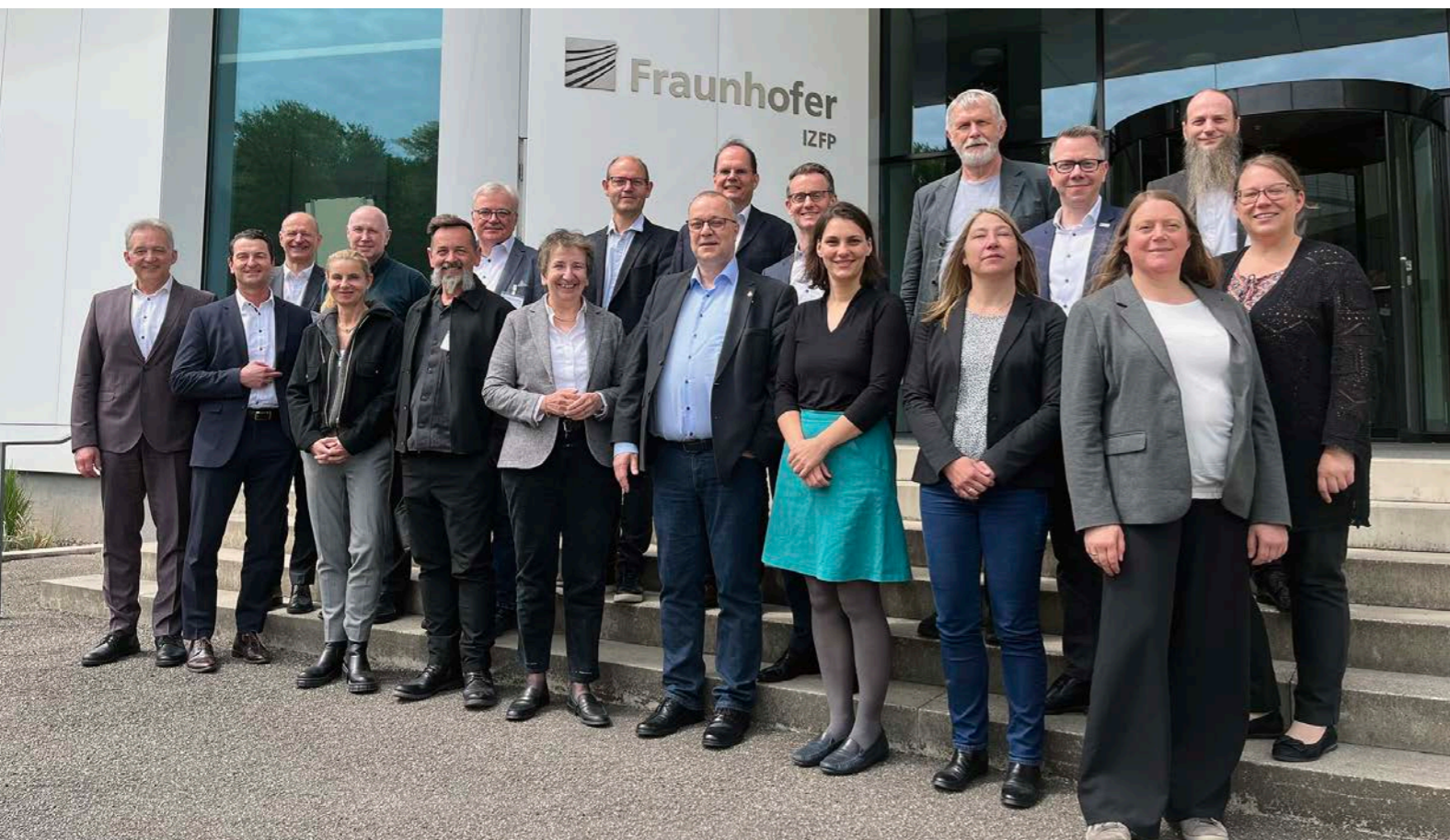
Das Kuratorium des Fraunhofer IZFP mit Vertreterinnen und Vertretern der Fraunhofer-Gesellschaft und des Instituts